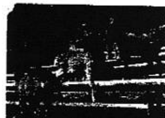
鹿の被害を逆利用。 鹿牧場地元設置で。