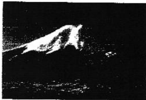
富士山が近くに見える。 登りやすい。