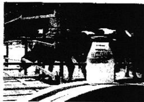
大野山牧場の牛。 育て農家に返す。