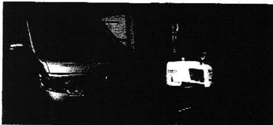
今、共和地区は厚い思いで取り組んでいる。 地域のできることは、地域でやる。 地域の足は地域が責任を持つ。