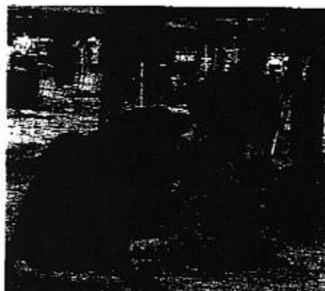
閉校と開校 共和地区 に合わせた 小学校 の再編 が、3月 に完了 した。