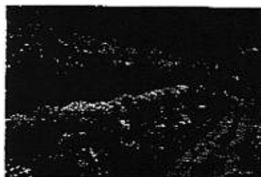
休耕地活用のコスモ ス蒔き。