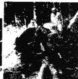
古道の再生へ。 県民との水源交 流、間伐体験。