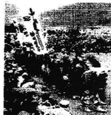
国指定重要無形文化財 5年に1回公開予定。