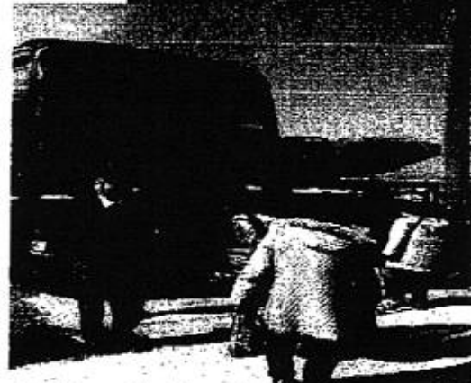
毎年、地域で県外視察。 今年は、学校後活用と 定住対策地を視察。